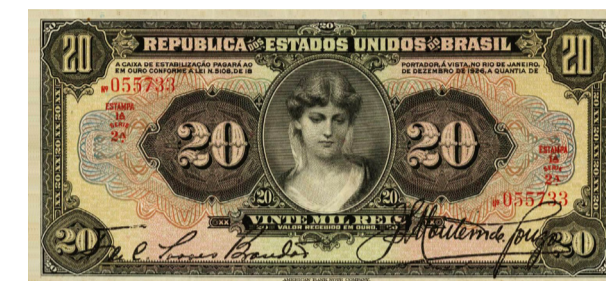
American Bank Note Company - 20$000 - 180 x 85 mm