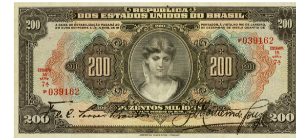
American Bank Note Company - 200$000 - 188 x 90 mm