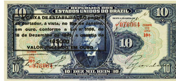
American Bank Note Company - 10$000 - 170 x 80 mm

Cédulas aproveitadas do Tesouro Nacional, com carimbo