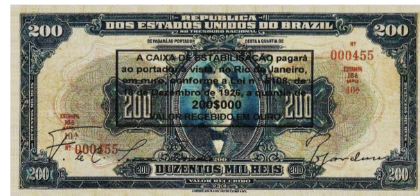
American Bank Note Company - 200$000 - 189 x 87 mm