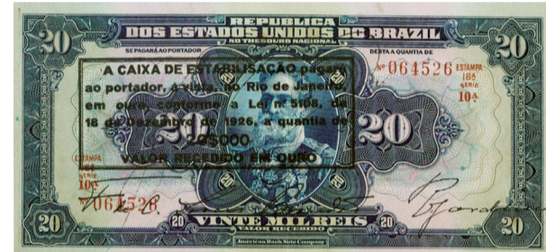
American Bank Note Company - 20$000 - 180 x 83 mm