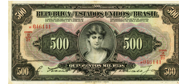
American Bank Note Company - 500$000 - 192 x 91 mm