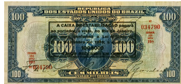
American Bank Note Company - 100$000 - 186 x 85 mm