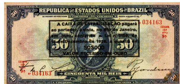
American Bank Note Company - 50$000 - 180 x 83 mm