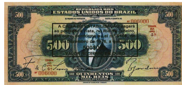
American Bank Note Company - 500$000 - 193 x 89 mm