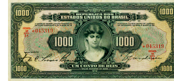
American Bank Note Company - 1:000$000 (1 conto de Réis) - 193 x 92 mm