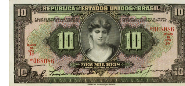
American Bank Note Company - 10$000 - 170 x 80 mm