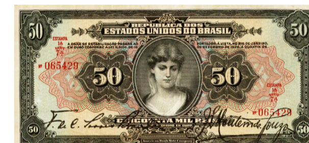
American Bank Note Company - 50$000 - 182 x 85 mm